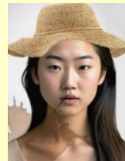
帶帽照或照片有鋼印/污損