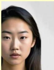
臉部被裁切(或觸碰到邊框)