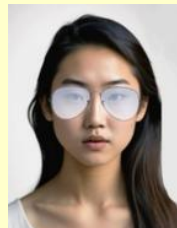
配帶有色眼鏡(或眼鏡反光)